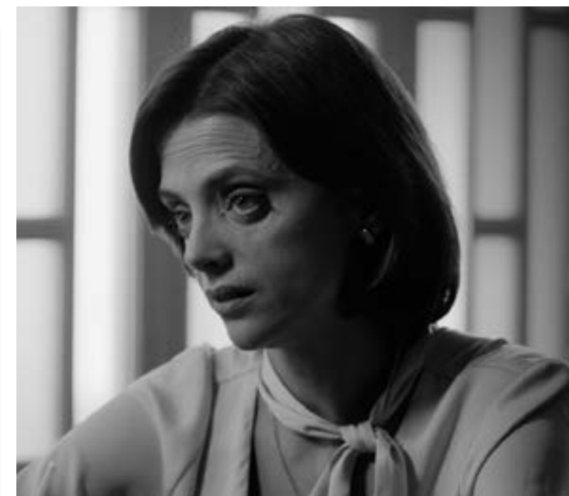
Macarena Gómez en una escena de la película dirigida por José Luis García, El crack cero.

“COMO DICE MI PADRE, ‘UNA MIRADA SUBYUGADORA, PENETRANTE Y ADHESIVA’ QUE ME HA AYUDADO MUCHO A TRABAJAR EN EL CINE”.